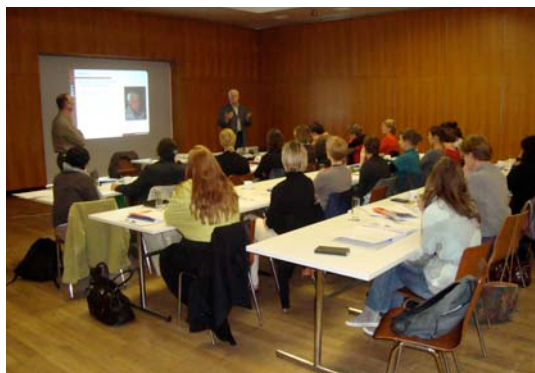
Introductie cursus 2009 gestart.

Niet-leden betalen 50€ en worden automatisch lid van de vereniging voor 2010.