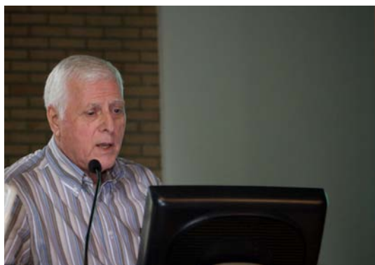
Ook u kunt het initiatief nemen om een voordracht te organiseren.

Indien u als therapeut of als organisatie (school, vereniging of instelling) interesse heeft om een voordracht te organiseren, dan kan u steeds met ons contact opnemen. Samen met u bereiden we dan dit evenement voor, zowel inhoudelijk als organisatorisch.